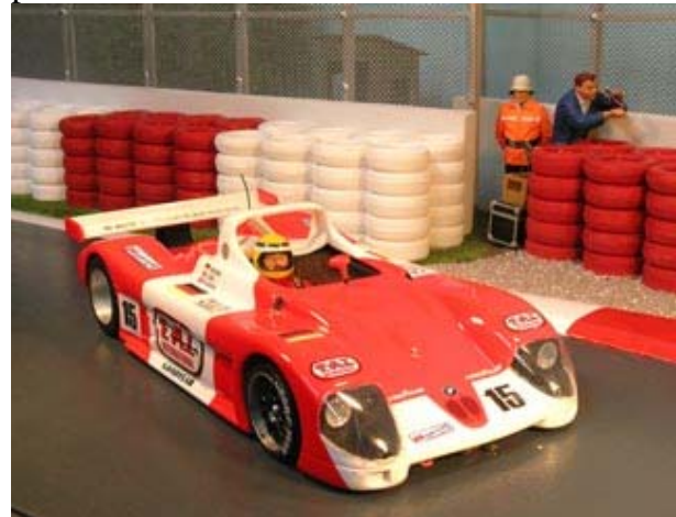
Hatte bis zum Schluss um Rang 4 zu kämpfen - BMW V12 LM von Bolz/Bolz . . .

Bei Stephan und Werner Bolz stellt sich nie die Frage nach dem Einsatzauto. Es wird halt immer der BMW V12 LM gefahren. Vor dem letzten Heat lagen auch Buchs/Bickenbach und Hermes/Schäfer auf Schlagdistanz innerhalb einer Runde, sodass SteBolz im letzten Durchgang auf Spur 4 noch einmal heftig Gas geben musste, um Platz 3 in dieser Gruppe zu erreichen (552,26 Runden), was „der Lange“ aber problemlos umsetzte.