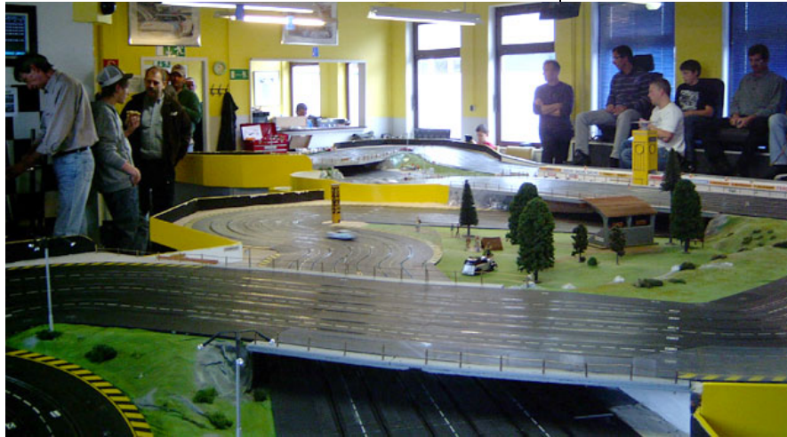
Die Moerser Bahn