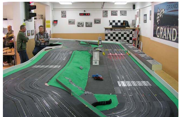
Alles halb so schlimm...

Doch, um es gleich vorweg zu nehmen, war das Gegenteil der Fall. Dank der freiwilligen Helfer des gastgebenden Clubs, die für eine ausreichende Anzahl Einsetzer sorgten, konnten herausgerutschte Fahrzeuge schnell wieder in die Spur gebracht werden. Doch auch die Fahrer legten eine gewisse Zurückhaltung an den Tag, wollte doch keiner ein zu hohes Risiko eingehen. So hieß es dann auch „Überholen und Überholen lassen“ und verbissene Zweikämpfe waren dann auch eher die Ausnahme.