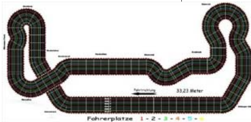
Die Strecke im Überblick