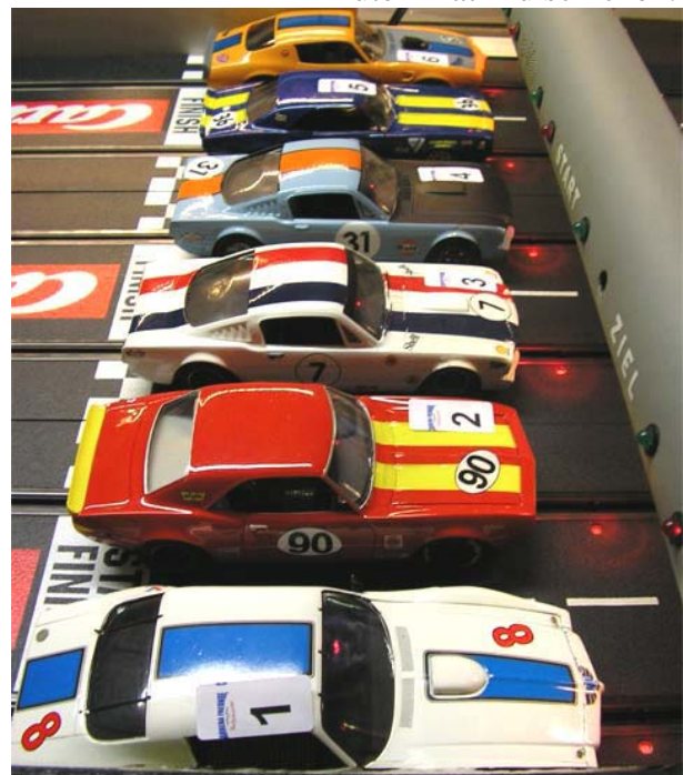
Und ewig dröhnen die Motoren!

Noch einen Kaffee, eine Zigarette und dann ging es wieder an die Bahn, um die Big Blocks auf die 6*5 Minuten-Hatz zu schicken.