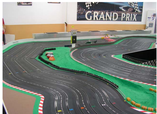
... oder doch nicht?