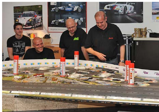
SLP-Cup Finale = Tombola = Entscheidungsnotstand!☺☺

Alles Weitere gibt's hier: Rennserien West / SLP-Cup