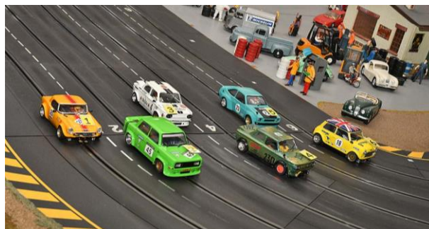
Die „Zwerge“ 2016-2020 immer im ScaRaDo...