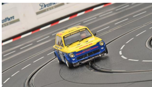
Und hier schon mal der kleine große Favorit...