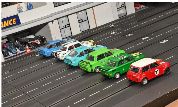
Die Klein(st)en 245 in 2023 nur zum Spaß...

„Zwergenaufstand“ am 16. Dezember 2023 in Kamp-Lintfort