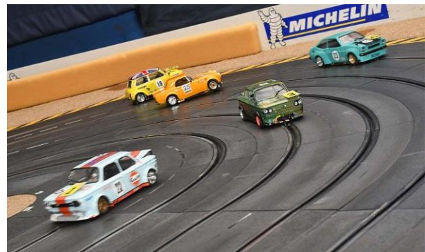
Ab 2024 rennen sie für die Gesamtwertung...