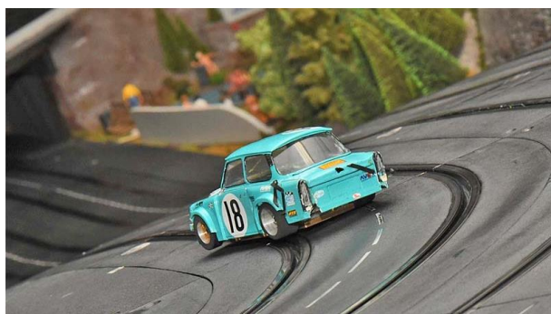
2023 ist Premiere für Kamp-Lintfort...