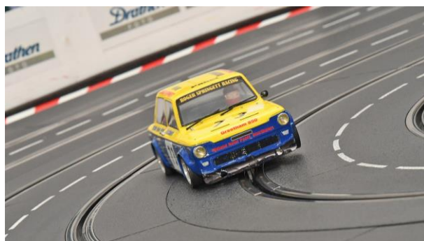
Und hier schon mal der kleine große Favorit...