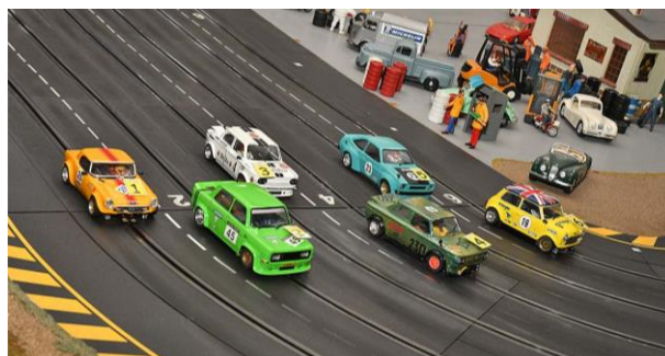
Die „Zwerge“ 2016-2020 immer im ScaRaDo...