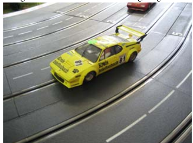
Gr.4 Fahrzeuge beim Probegalopp 2007 im Hochsauerlandkreis . . .