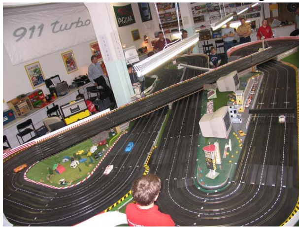
Luftbild des „runden“ Kurses in Arnsberg - der Rennleiter hat alles im Blick . . . !!

Der Austragungsort liegt in den Sauerbergen, exakter auf der 35½m-Strecke des Modellrennbahnclub Hochsauerland in Arnsberg.