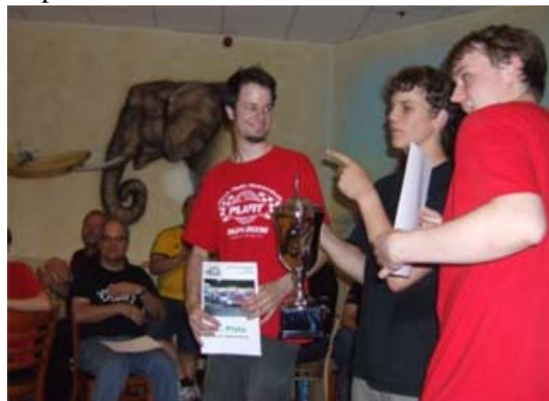
Die PQ nach dem SLP-Cup Meeting 2008 . . .

werden mit dem ein oder anderen Slot-Ringer (als Gaststarter dabei) um die Spitze rangeln. Welcher Pilot dabei letztlich die Nase vorn haben wird, dürfte auf dem aktuellen Informationsstand kaum vorherzusagen sein. Fakt ist, dass die PQ die Schwerpunkte ihres Engagements auch in 2009 nicht zwingend im SLP-Cup sehen . . . ☺☺