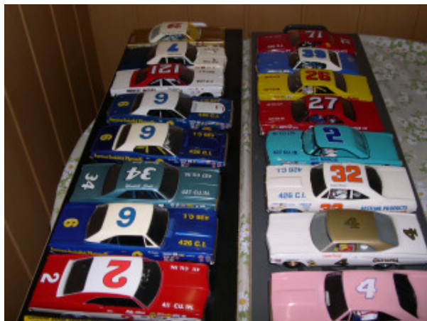
...Grand National Slotcar !!