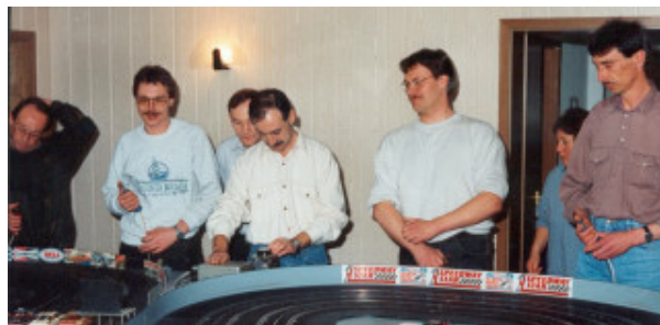
...Buchholz Raceway in DU !!