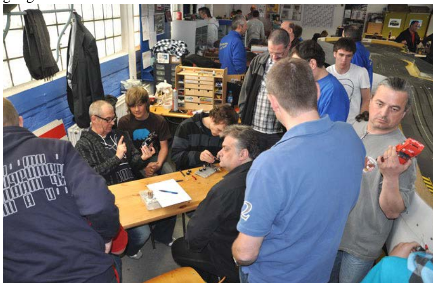
Rummel beim Teamrennen anno 2010 . . .

Reifenwechsel sind im Rennen übrigens nicht vorgesehen – außer natürlich bei Beschädigung eines Rades!