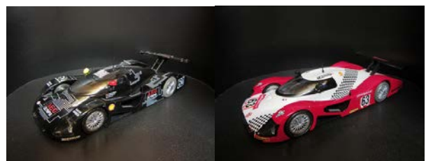
...Beispiel Audi R 8R LM