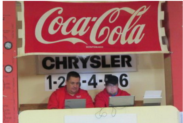
...die Profis der Rennleitung „ThommiMH“ und „The Whistler“ ☺☺!