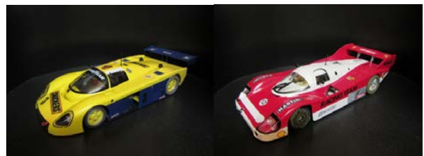
...Beispiel Gr. C: hier Toyota + Porsche