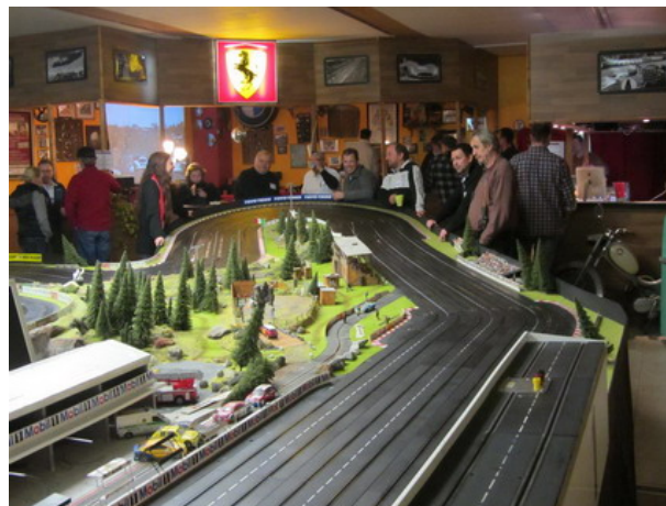
...voller Bahnraum !!

für die rennpiste nicht, da dort in 2012 acht Mal 1:24 Serien Station machen werden.