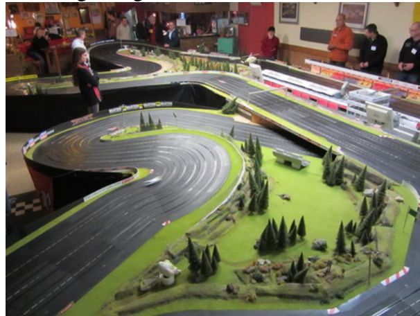
...die trickreiche Auffahrt zur Brücke !!

...ist eine Gemeinschaft von Slotracer/Innen, die seit 2008 eine Rennserie mit 1:32 Slot it Fahrzeugen organisiert und durchführt.