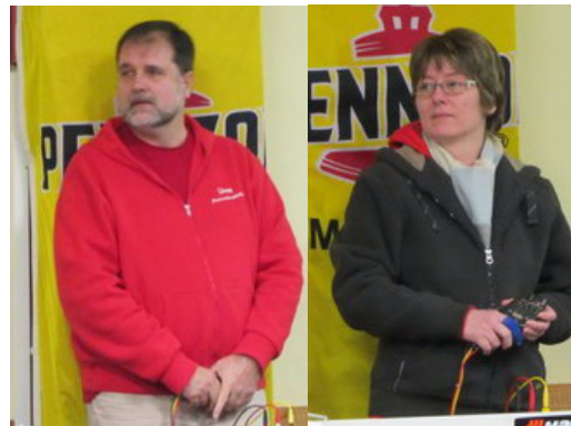
...das 8-köpfige HvK Team ☺☺!