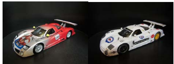
...Beispiel Nissan R390 GT1