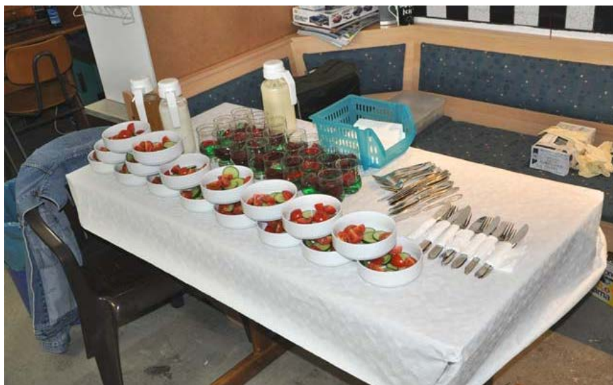
Der Blick auf die Verpflegung aus 2010 lässt bereits im Vorfeld das Wasser im Mund zusammen laufen . . .