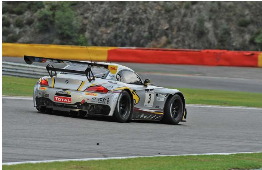
Der Z4 GT3 darf jetzt auch mitspielen . . .

Last but not least wurde der BMW Z4 GT3 als 3. Fahrzeugtyp in der K1 homologiert.