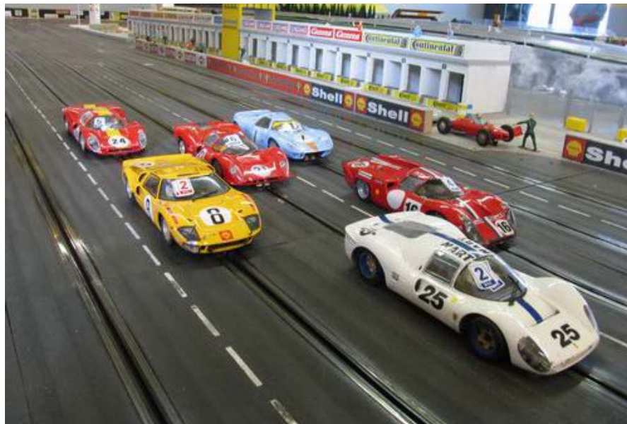
24h anno 2004

Wie in den Jahren zuvor wird das Rennen parallel auf den beiden Moerser Carrerabahnen simultan ausgetragen. Nach jeweils vier Stunden wechseln die „große“- und die „kleine“ Gruppe das Geläuf, so dass jedes Team beide Bahnen während der 24h-befahren kann.