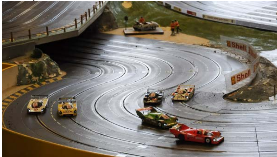
Die kleine Gruppe 2012

Nach dem positiven Feedback aus dem Vorjahr haben wir uns wieder dazu entschlossen die beiden Startgruppen für das Rennen mit unterschiedlichen Maßstäben zu fahren – frei nach dem Motto „1:32 meets 1:24“.