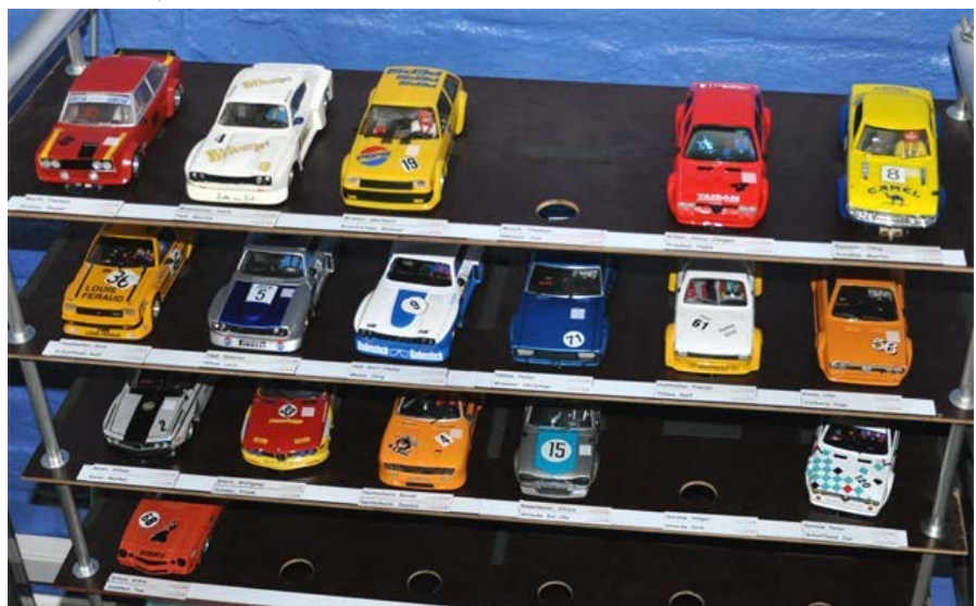
Der fast vollständige Fuhrpark beim Tourenwagen Teamrennen vor drei Jahren ...