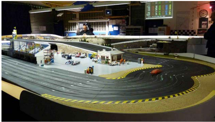
Der Kurs ...