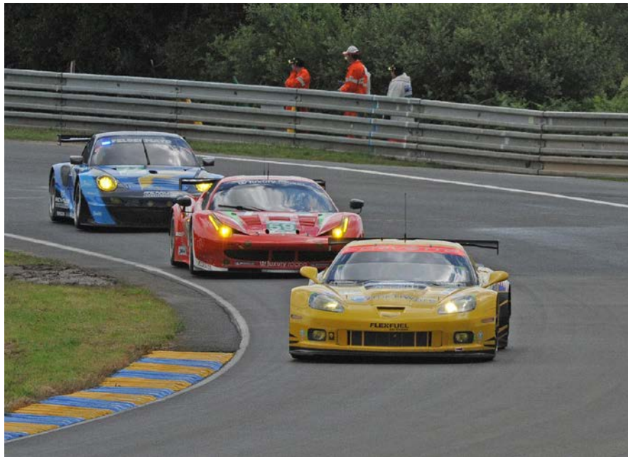
Grand Slam: Slotracing nach Vorbildern moderner GT2- und GT3-Fahrzeuge mit Beleuchtungsanlage.