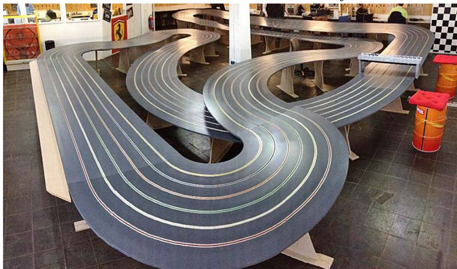
Eines der ersten Fotos von der neuen, 6-spurigen Holzbahn ...