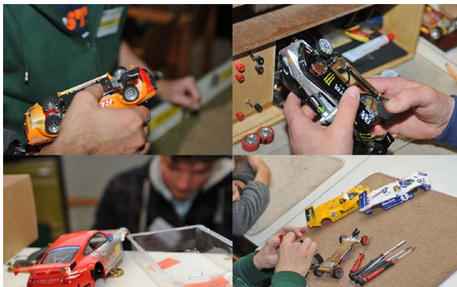
Workshop Szenen aus dem Dezember ...