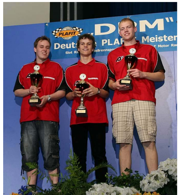
Der „Warschau“ anno 2009 als „PQ“ verkleidet (rechts im Bild) – möge er am WE 'ne andere Hose mithaben!☺☺

In die Rubrik „Geheimtipp“ bzw. „Verfolger“ gehören vier weitere Teams, die den oben Genannten durchaus Scherereien machen können, wenn alles passt: