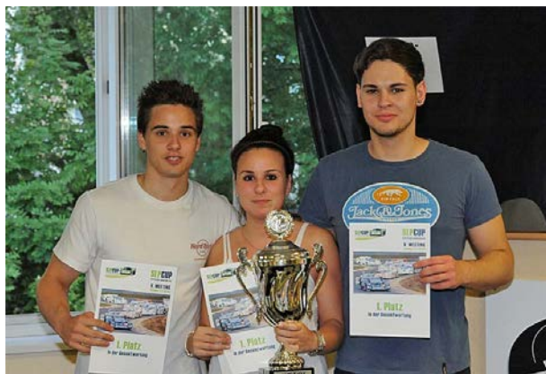
Leider keine Titelverteidigung für „PQ2“!☹☹

Für den Rest des Feldes sind 480 bis 485 Runden pro Durchgang eine echte Challenge. Wer das packt, darf mutmaßlich in der schnellsten Startgruppe antreten . . .