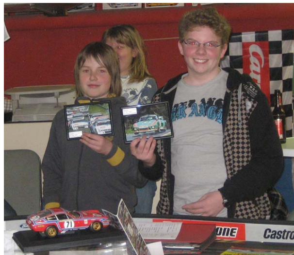
245 in Köln anno 2008: Der „Nachwuchs“ – mit etwas Glück auch heuer wieder am Start!?

In Sachen Strecke gelten nach wie vor die Erkenntnisse aus 2008: Für die große Bahn sollte man bei ca. 28,5mm Wegstrecke pro Motorumdrehung beginnen. Viel länger ist wenig sinnvoll, weil dann der Druck in den engen Ecken fehlen wird. Kürzer geht allemal . . . ☺ „...., dass man auf dem 49m Kurs mit 1mm Luft zwischen Chassis und Einstellplatte nicht gut fährt! So 1,2 bis 1,3mm Bodenfreiheit dürfen es durchaus sein – und ein wenig mehr ist nicht wirklich schädlich . . .“