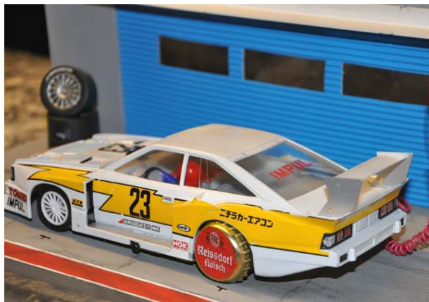
In 2010 auf den Punkt gebracht: Gruppe 5 und Kölsch . . .

Fünf Jahre in Folge fuhr die Gruppe 245 ihr Finale in der Domstadt – zuerst auf beiden Bahnen, später nur noch auf dem großen Kurs. Für dieses Jahr gibt's eine Finalpause und mit dem Lauf unter dem Dom ist die 245 Saison noch nicht beendet. Das ist's aber auch schon mit den Änderungen – das Reglement ist seit Jahren stabil und auf dem schnellen Kurs wird wie in jedem Jahr mit vielen spannenden Rennen zu rechnen sein . . .