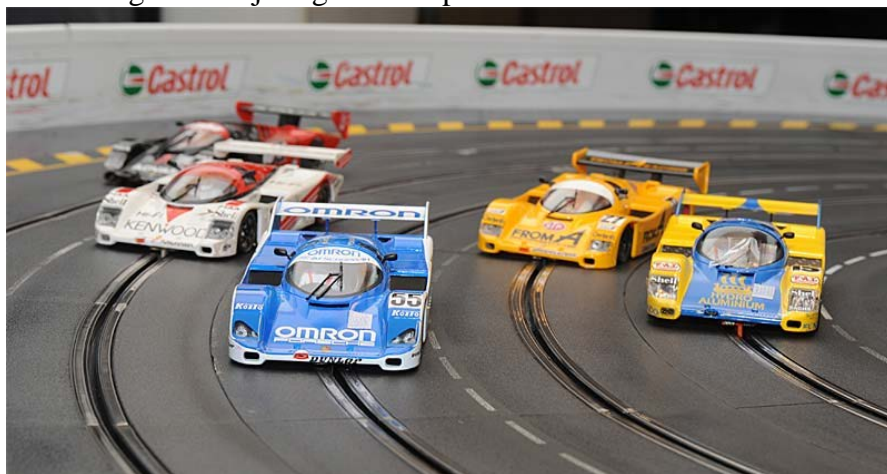
SLP-Cup anno 2012 in Schwerte . . .