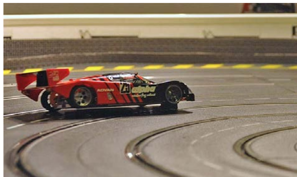
SLP-Cup in Schwerte: Stunts inclusive . . .