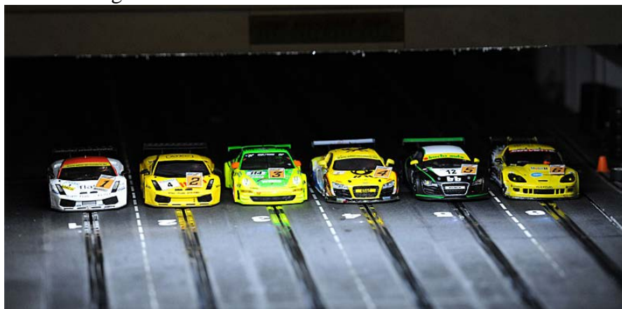
Die schnellste Startgruppe im ScaRaDo anno 2012 vor dem Start in den 2. Wertungslauf . . .