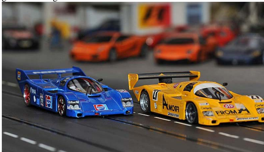
Schwerte calling ...