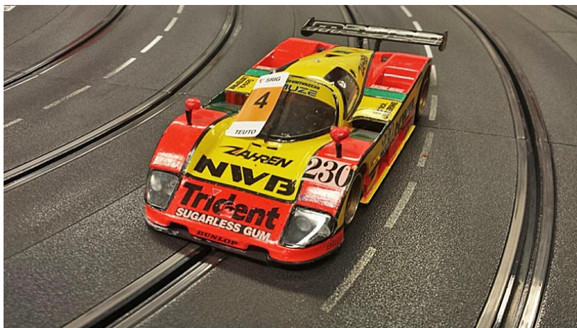
Mazda im technischen Pech . . .