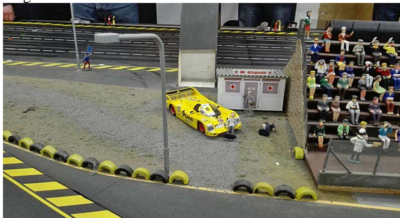
Der Ausflug . . .

Für Fabian lief es leider nicht nach Plan: Einige Abflüge und damit verbundenem Grip Verlust durch schmutzige Reifen machten ihm das Leben schwer. Höhepunkt war der „Ausflug“ in die Boxengasse auf der Start/Ziel-Geraden. Abbiegen auf einer Geraden ist an sich schon sehenswert, aber die Schleifspur durch die arg verstaubte Boxengasse trug dann vollends zur (sagen wir es vorsichtig) Erheiterung der Umstehenden bei *gg*. Seine Reifen sahen hinterher aus als hätten sie Bartwuchs angesetzt. Um ihm aber den Abend nicht komplett zu versa....., entschied man gemeinschaftlich die Reifen mit Klebeband abzuziehen, was ihn jedoch auch nicht über Platz 12 der Gesamtwertung hinaus brachte.