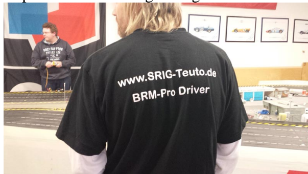
So sehen „Siegerrücken“ aus . . .

Wir dürfen nun also gespannt sein, wie sich die Saison entwickelt, denn der Kreis der Topleute ist definitiv größer geworden.