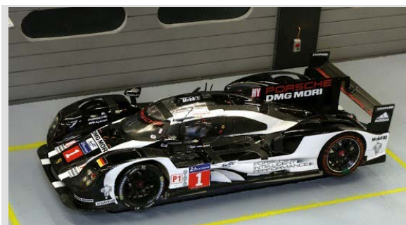
SG Stern - Slotfabrik Fola Osu Bert van Dam