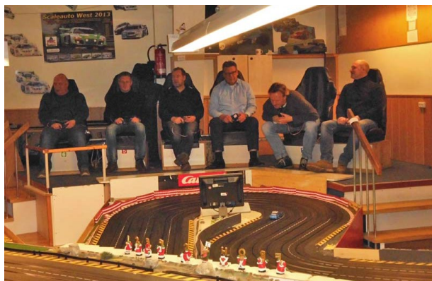
Mit neun Teilnehmern gute Beteiligung beim Finale ...