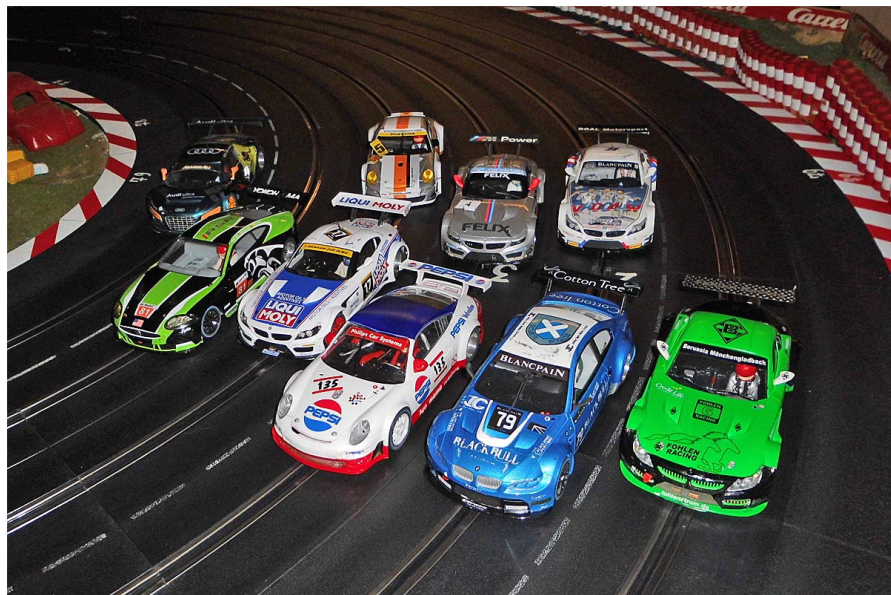
Finale des GT-Sprint in Kamp-Lintfort

Es wurde gefahren was der Drücker, das Auto und die Nerven der Fahrer hergaben.