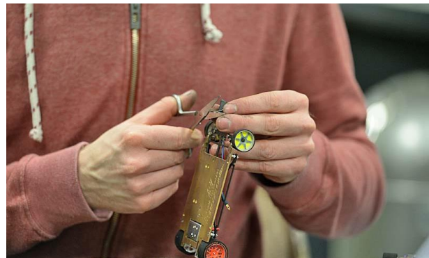
Sebastian gönnt sich sogar noch neue Schleifer!

Aufgrund der überschaubaren Belegschaft einigte man sich auf 6 Minuten Fahrzeit pro Spur. Dabei wurde bereits spekuliert, ob die Cars diese lange Zeit wohl ohne technischen Defekt überstehen würden . . .