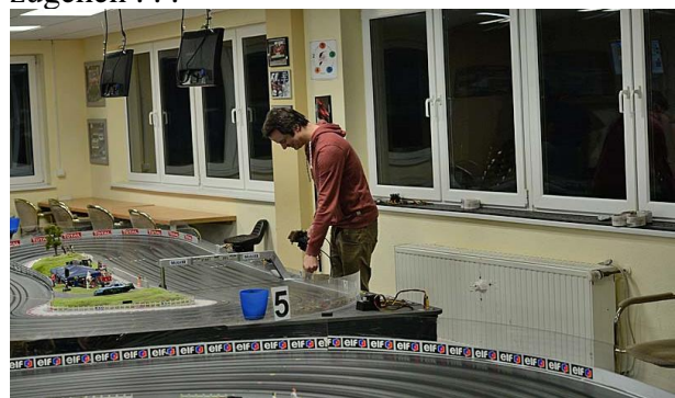
Auf und ab beim Champion: Letzter bei der technischen Abnahme – Erster an den Fahrerplätzen – beinahe Letzter dann im Rennen . . .

Schaden hin, Schaden her – dem Champ aller drei „kein CUP!“ Jahre fehlte im Dorf der notwendige Grip. Die von den anderen vorgelegten Zeiten vermochte er nur auf seinen „Stammspuren“ Vier und Fünf halbwegs mitzugehen . . .