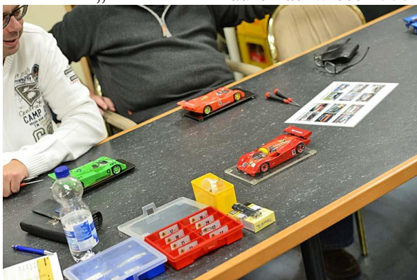
Materialausgabe . . .

Das erforderliche Gripfahren wurde insofern erschwert, als 40% der Belegschaft durch die Staulage nachhaltig verspätet durch die Tür kam. Dementsprechend ließ man sich Zeit, bis es zur Ausgabe der Triebwerke ging. Bei so viel Routine war der Part Materialausgabe eh rasch abgearbeitet. „Routine“ insofern, als die Teilnehmer bislang alle Saisonläufe absolviert hatten und in Summe die Erfahrung von 55 absolvierten „kein CUP!“-Läufen aufwiesen . . .