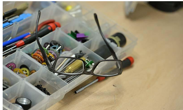
Durchblick war bei der Fahrzeugvorbereitung gefordert!

Aufgrund der überschaubaren Belegschaft einigte man sich auf 6 Minuten Fahrzeit pro Spur. Dabei wurde bereits spekuliert, ob die Cars diese lange Zeit wohl ohne technischen Defekt überstehen würden . . .