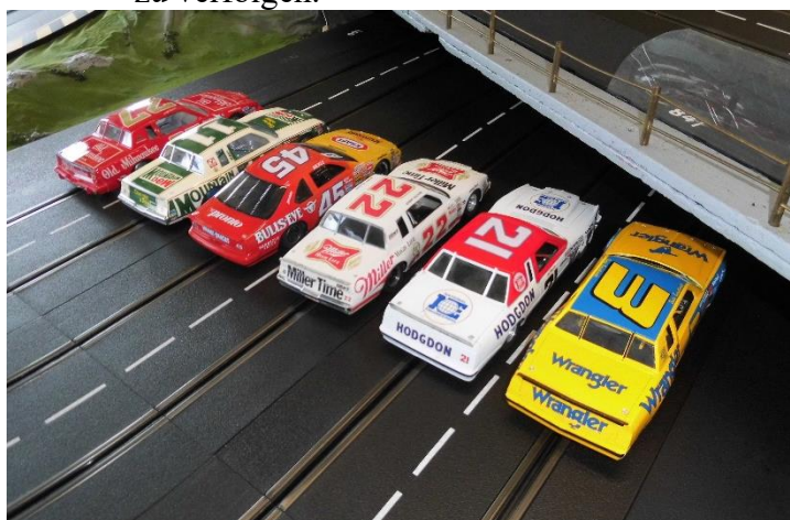
Erste Startgruppe in Heat 1

Nach Moers kamen dann zwei Racer aus Melle,