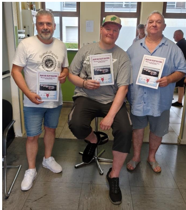
Die drei Sieger, herzlicher Glückwunsch!

Ein Lob und ein Dank aber auch an alle Aktiven, die für einen erstaunlichen und engen Rennverlauf gesorgt haben – es ergaben sich vielen Teilmeterentscheidungen über die ganze Ergebnisliste, bravo!